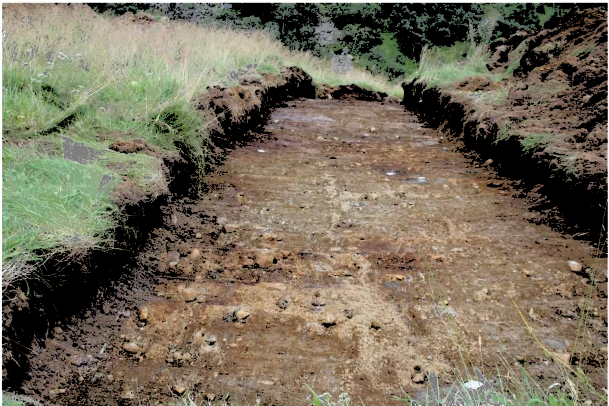
Fig 4. Sjakt 6, bildet tatt mot øst.

Det ble ikke avdekket automatisk fredete kulturminner i noen av sjaktene.