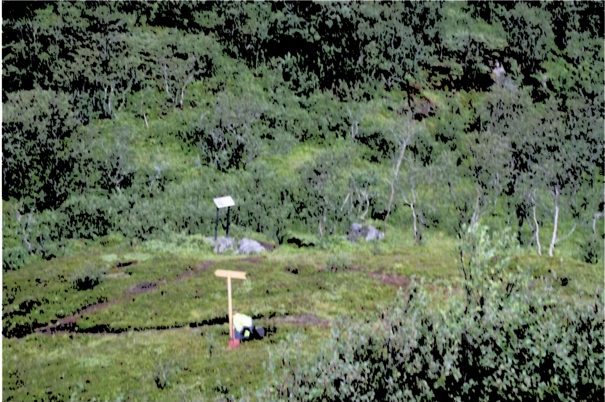
Fig 5. Området som ble prøvestukket. Bildet er tatt mot N.