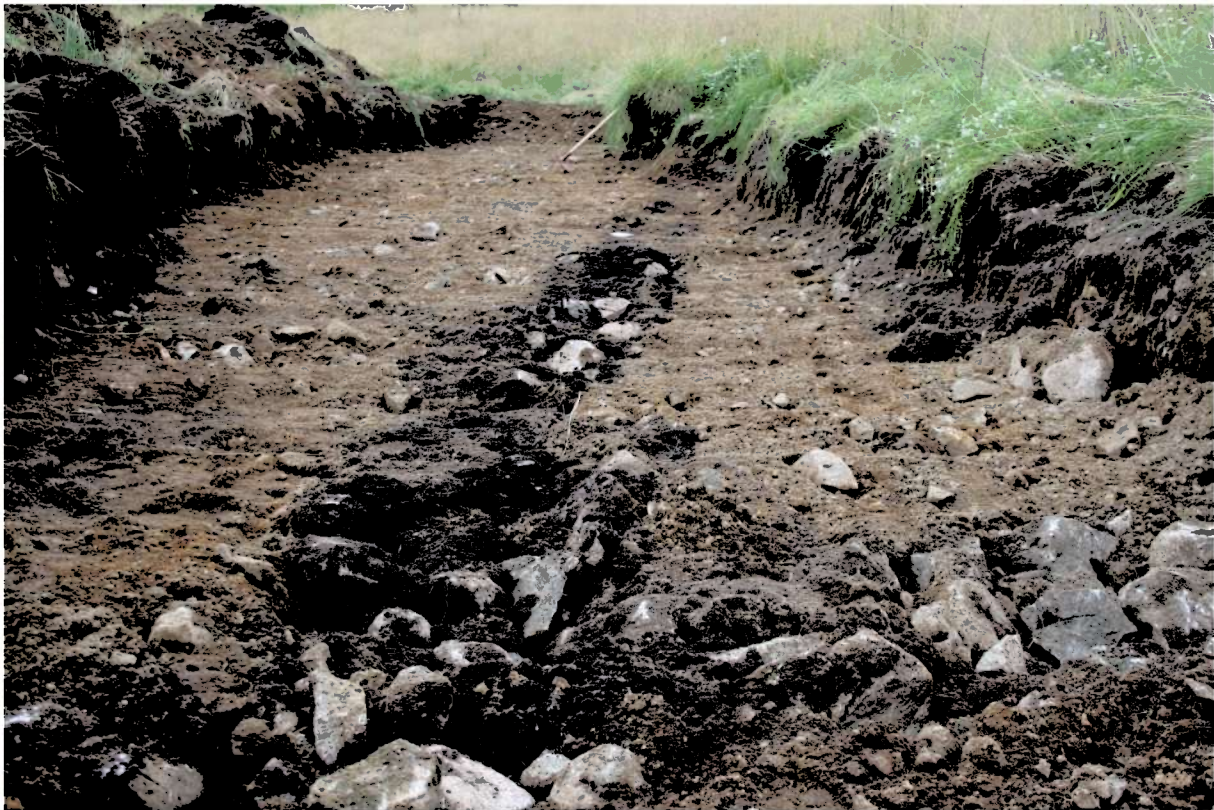
Fig 3. Sjakt 2 med steinsatte grøfter.

Sjakt 6: Gulbrun – grå sand. En god del stein i sjakta.