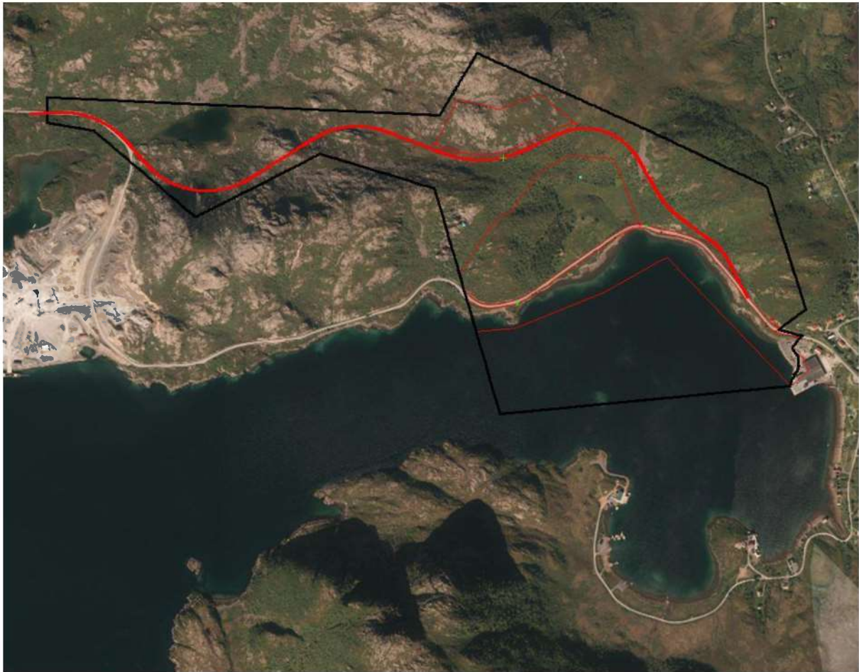
Fig 2 Oversikt over tiltaksområdet

Nordland fylkeskommune vurderte området til å inneha potensial for påvisning av hittil ukjente kulturminner. Det ble først gjennomført en innledende befaring på stedet for å fastslå behovet for en større og mer utførlig arkeologisk undersøkelse.