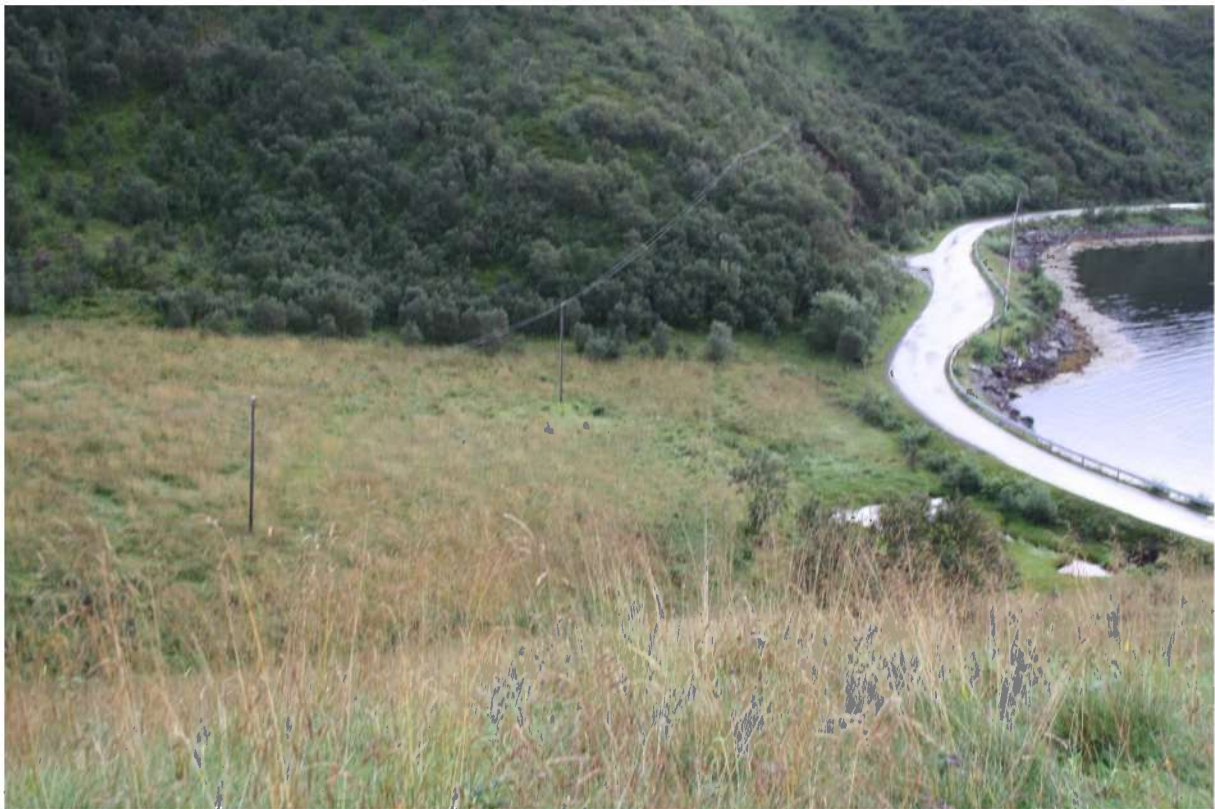
Oversikt over del av planområdet, bildet tatt mot øst.