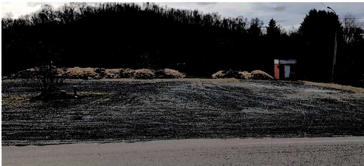
Bildet 6 – nord for bussholdeplass ved skolen. Et åpent areal langs riksveien, uten definert inn og utkjøring.

Under reguleringsarbeid skal eksisterende avkjørsler vurderes. Eventuell stenging eller innstramning av disse kan bli aktuelt. Eksempel på en av avkjørsler som skal vurderes er på bildet under.