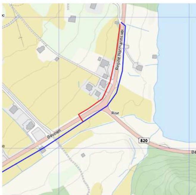
Bildet 4 -2 alternativer for trasevalg

Oppstartsmøte med befaring ble gjennomført 8.mai 2019. Gang- og sykkelvei trase avmerket med blå strek er foreslått fra Bø kommune.