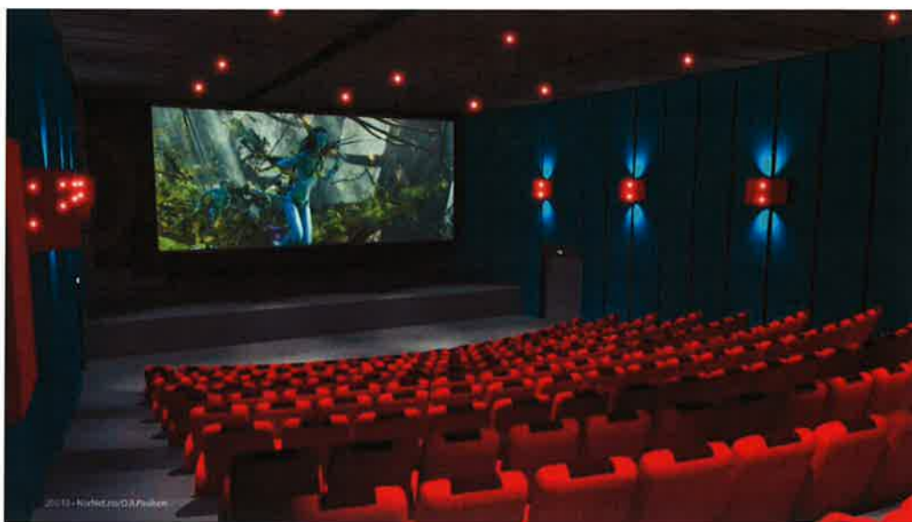
Slik kan den nye kultursalen tilknyttet Bøhallen bli! O. R. Paulsen/ NorNet