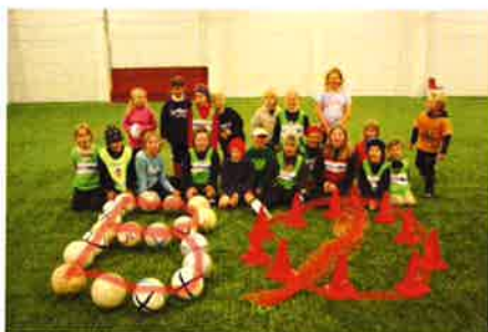
Det er flott i Lunahallen!

Store deler av bygningsmassen i Bø tilknyttet fysisk aktivitet og naturopplevelse eies og driftes av lag og foreninger. Bø kommune drifter i dag verken idrettshaller eller svømmebasseng. Alle tiltak i planperioden der Bø kommune er tiltakshaver eller har noe form for økonomisk forpliktelse skal sees i sammenheng med kommunens økonomiplan, og avhenger av nødvendige årlige budsjettvedtak. Dette gjelder både bygging og drift. For økonomiplan tilknyttet planen vises det derfor til vedtatt økonomiplan for Bø kommune og til de vedtatte budsjetter for kommunens drift og investeringer.